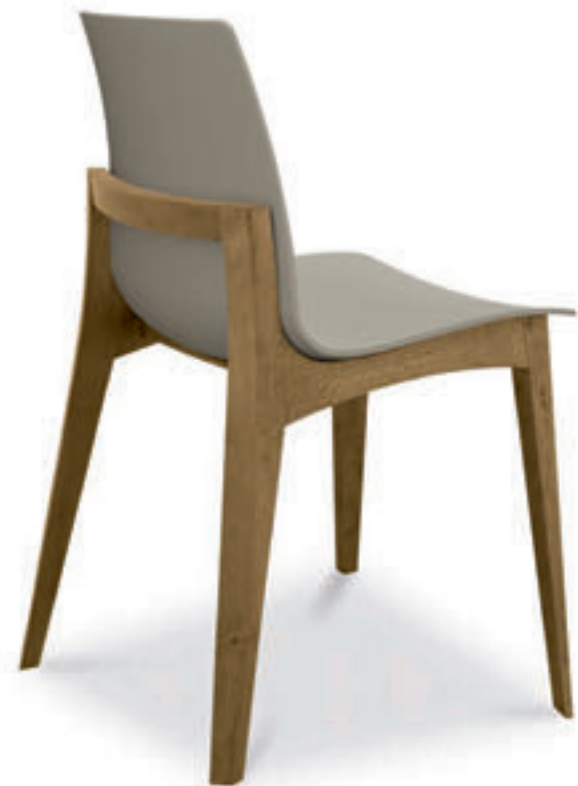
sedia MABEL - cod. 2MA1DE seduta in polipropilene CORDA struttura in LEGNO GROOVE

MABEL chair seat: polypropylene CORDA wood structure: GROOVE