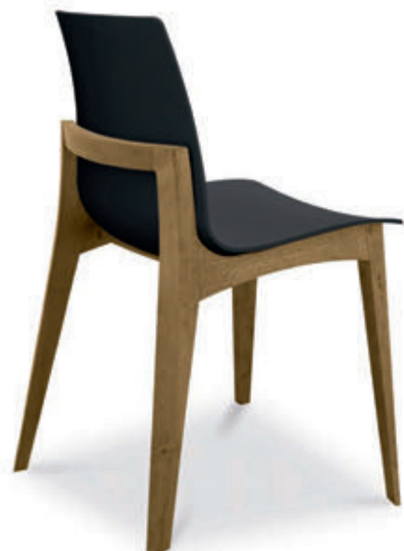
sedia MABEL - cod. 2MA1CE seduta in polipropilene CARBON struttura in LEGNO GROOVE

MABEL chair seat: polypropylene CAFFÈ wood structure: GROOVE