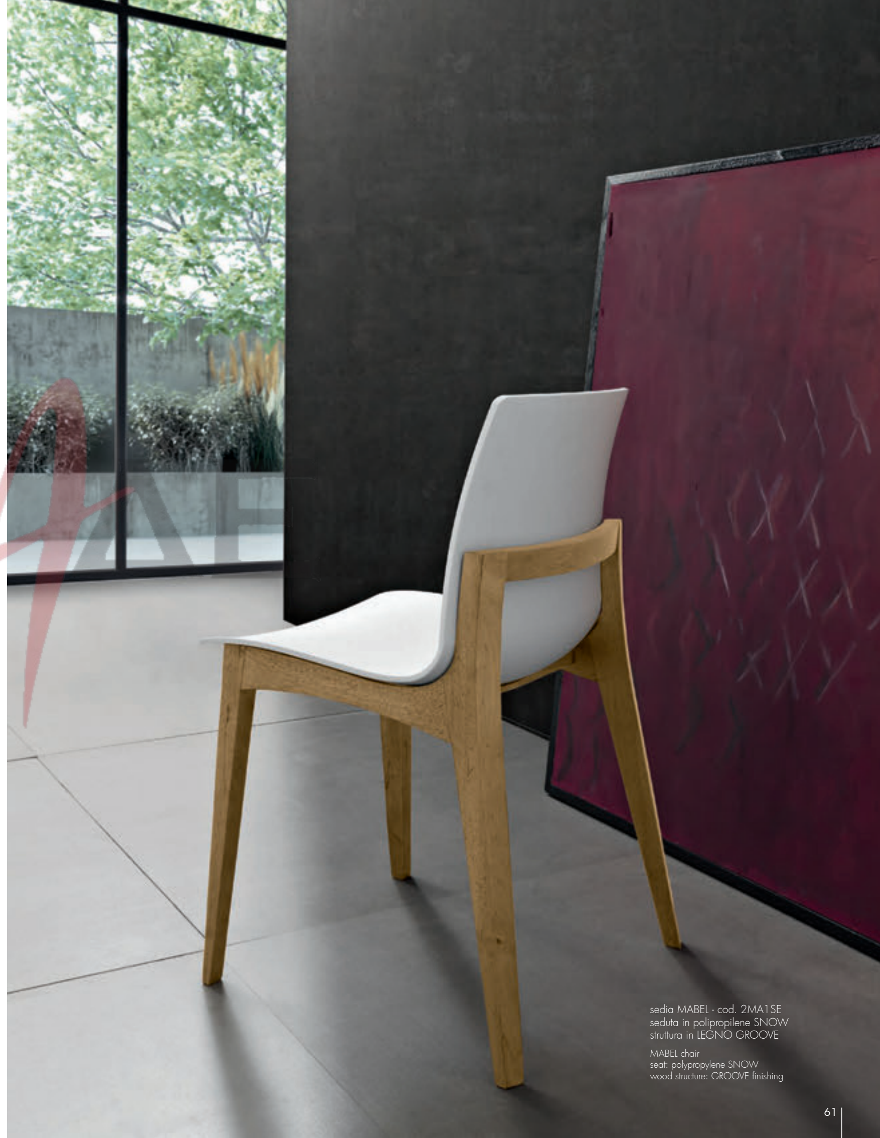
sedia MABEL - cod. 2MA1SE seduta in polipropilene SNOW struttura in LEGNO GROOVE

MABEL chair seat: polypropylene CARBON wood structure: GROOVE