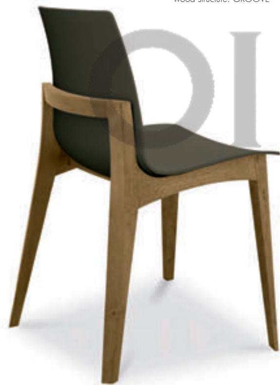
sedia MABEL - cod. 2MA1EE seduta in polipropilene CAFFÈ struttura in LEGNO GROOVE

MABEL chair seat: polypropylene CORDA wood structure: GROOVE